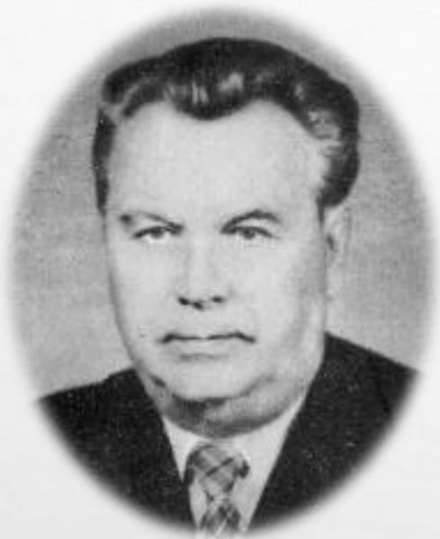
Георгий Соколов участник ВОВ, комиссар, командир разведроты, член Союза писателей СССР

В Новороссийске, на берегу Цемесской бухты, высится бронзовый памятник Неизвестному матросу. В руке у матроса автомат, на могучих плечах - плащ-палатка, на голове - бескозырка чуть набекрень.