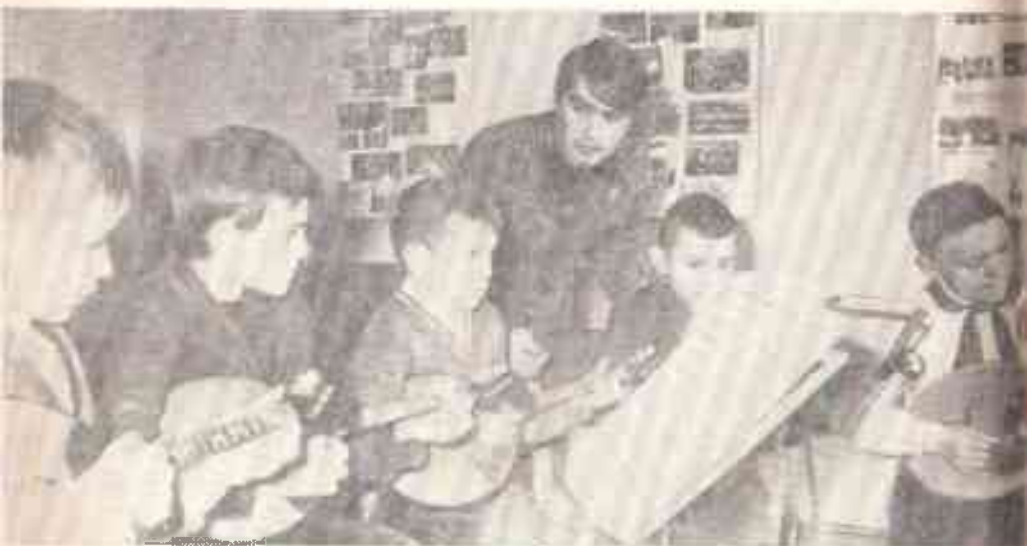
Юные домбристы Северского районного Дома культуры.