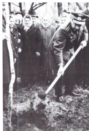
Посадка дерева в с. Крымское. 1989 год

В 1977 году первую ель у пешеходной дорожки, ведущей к зданию исполкома, посадил дважды Герой Советского Союза лётчик-космонавт Виктор Горбатко.