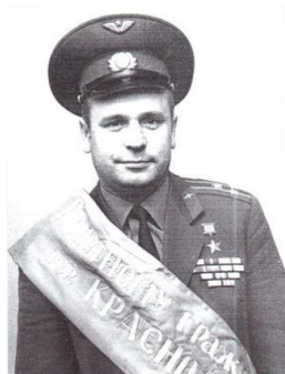
Портрет Героя Советского Союза Виктора Горбатко. 1989 год

В 1977 году первую ель у пешеходной дорожки, ведущей к зданию исполкома, посадил дважды Герой Советского Союза лётчик-космонавт Виктор Горбатко.