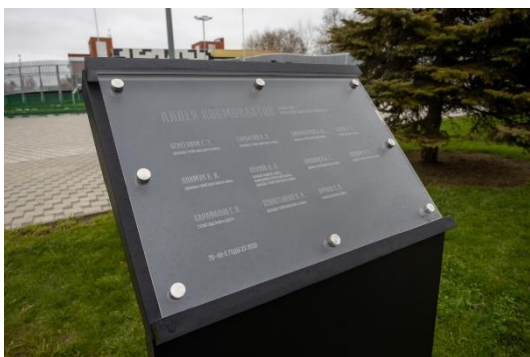
Памятный знак с именами 11 космонавтов в Анапе

Вот каким способом космонавты, освоившие космос, оставили свой след в городе-курорте Анапа.