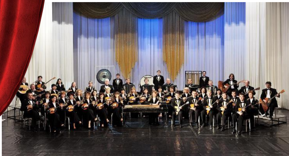
Русский народный оркестр «Виртуозы Кубани»

На базе учреждения работает около 20 местных коллективов, которые продолжают традиции русского музыкального искусства. Наиболее известные из них – Филармонический оркестр, Государственный камерный хор, Русский народный оркестр «Виртуозы Кубани», Ансамбль песни и танца «Кубанская казачья вольница» и Государственный балет Кубани.