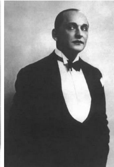
Александр Николаевич Вертинский