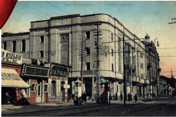
Здание бывшего Зимнего театра. 1909 г.

Здание филармонии построено в 1909 году по проекту гения модерна Фёдора Шехтеля. Возводилось оно для Зимнего театра, на сцене которого выступали многие знаменитости первых десятилетий XX века: танцовщицы Матильда Кшесинская и Айседора Дункан, оперный тенор Леонид Собинов, поэты-футуристы Владимир Маяковский и Игорь Северянин, шансонье Александр Вертинский и другие.