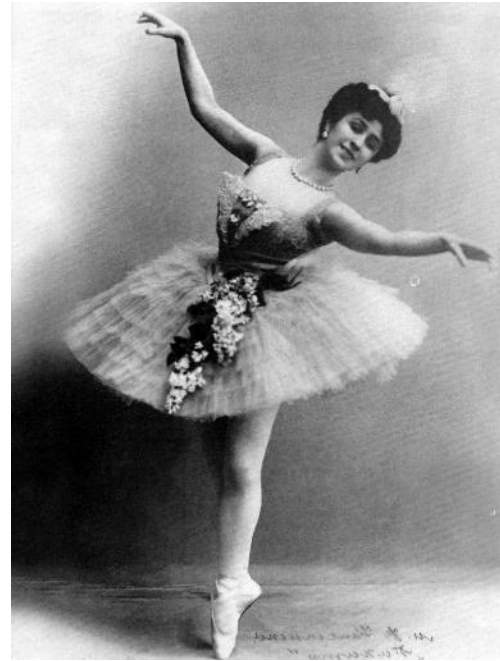
Матильда Феликсовна Кшесинская