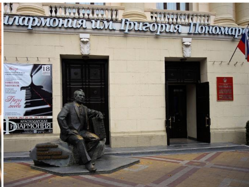
Памятник Григорию Пономаренко у здания Краснодарской филармонии