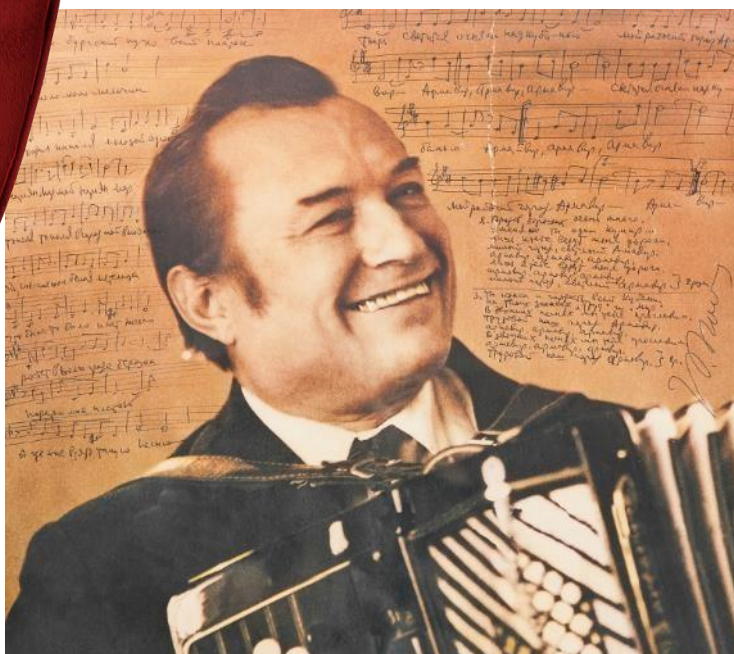
Григорий Фёдорович Пономаренко

Новый этап развития филармонии пришёлся на 1970-е годы, когда в Краснодар приехал работать композитор Григорий Фёдорович Пономаренко. Живя на Кубани, музыкант плодотворно работал с местной поэзией, существенно расширив репертуар филармонии. Неудивительно, что вскоре после его трагической гибели ей присвоили имя маэстро.