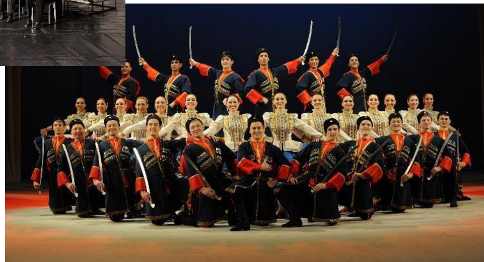
Ансамбль песни и танца «Кубанская казачья вольница»